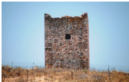
Ο πύργος της Λιάδας στο Μαρκόπουλο The Liada Castle in Markopoulo

Markopoulo since the mythic era suffered, like the whole Attica, from the several invasions. The first is depicted within the era of Kserksis, which, when came in order to conquer Athens went for general depopulation of Attica, returning as well from the sea fight of Salamina stole the statue of Artemida from the area of Vravrona. In the Middle Age (395-453 A.C) the Crusaders, the Venice and the Catalans as also later (1265-1466 A.C) the Arabs devastate the coast of Attica with their invasions. The Vecice left as samples of their presence in Attica several towers that were used as fortresses and viewpoint. Two such Venice towers are preserved until today in Markopoulo. One of the towers stands in the area of Vravrona on the hill which is against to and North from the Saint Dimitrios church while the