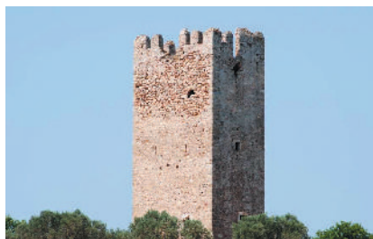
Ο πύργος της Βραυρώνας στο Μαρκόπουλο The Vravrona Castle in Markopoulo

Οι ιστορικοί αναφέρουν ότι το Μαρκόπουλο, από την μυθική εποχή, υπέφερε, όπως και όλος ο νομός Αττικής, από επιδρομές διαφόρων λαών. Η πρώτη εξ αυτών χρονολογείται από την εποχή του Πέρση στρατηγού Ξέρξη, ο οποίος, ερχόμενος προς κατάληψη της Αθήνας, προέβη σε ερήμωση όλης της Αττικής, όταν δε, μετά την ναυμαχία