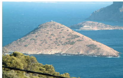
Ο κόλπος του Ράφτη (Πόρτο Ράφτη) με τη νησίδα Ράφτης The gulf of Raftis (Porto Rafti) with the islet of Raftis

North- east of the city of Markopoulo there is a big area called "Vraona", where the ancient municipality