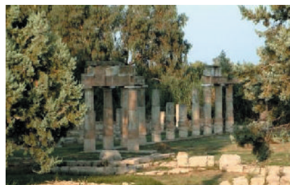
Η στοά των άρκτων στο ιερό της Βραυρωνίας Αρτέμιδος The stoa of bears in the sanctuary of Vavronias Artemis

Βορειοανατολικά της πόλεως του Μαρκοπούλου βρίσκεται η Βραώνα. Εδώ τοποθετείται ο αρχαίος Δήμος της Βραυρώνας, η δε πόλη της αρχαίας Βραυρώνας στην θέση «Κολυμπάκι» όπου και ευρέθησαν τα ερείπια αρχαίου οικισμού και ναού. Η περιοχή είναι πολύ εύφορη, οι ιστορικοί δε αναφέρουν ότι κατά την αρχαιότητα υπήρχαν μεγάλα κριθάρια, τα ονομαζόμενα «Αχιλλειδες», από το όνομα ενός γεωργού, του Αχιλλέως. Εδώ, τιμούσαν την «Βραυρωνία Αρτέμιδα». Στην θέση που σήμερα βρίσκεται ο ναός του Αγίου Γεωργίου ήταν ο βωμός της Αρτέμιδος. Δυτικότερα, σε απόσταση 200 μέτρων, προ ετών βρέθηκαν ερείπια αρχαίου ναού, τα οποία, για λόγους προστασίας,